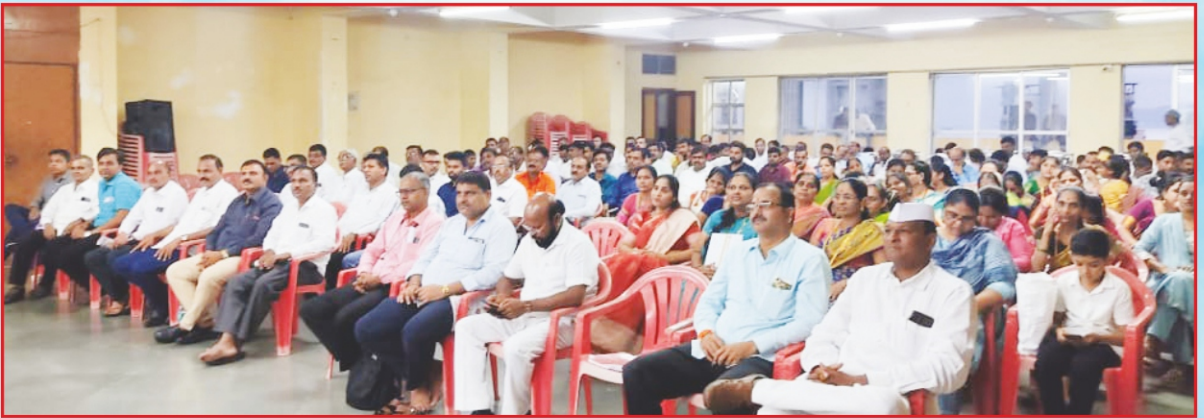
२८ व्या वार्षिक सर्वसाधारण सभेप्रसंगी उपस्थित सभासद वर्ग.