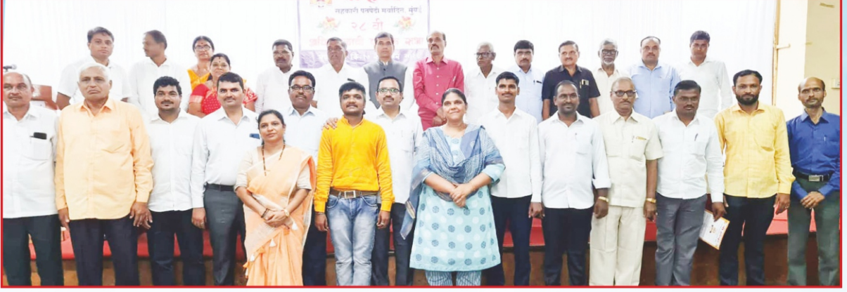
२८ व्या वार्षिक सर्वसाधारण सभेप्रसंगी उपस्थित संचालक मंडळ व कर्मचारी वर्ग