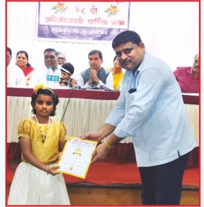
२८ व्या वार्षिक सर्वसाधारण सभेप्रसंगी गुणवंत विद्यार्थ्यांना व सभासद पालकांना पारितोषीक देताना संचालक.